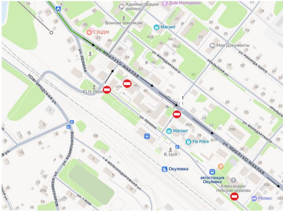
Схема перекрытия движения всех видов транспорта на 19.09. 2025 года

Дорожный знак 3.1 «Въезд запрещен» — Маршрут временного объезда