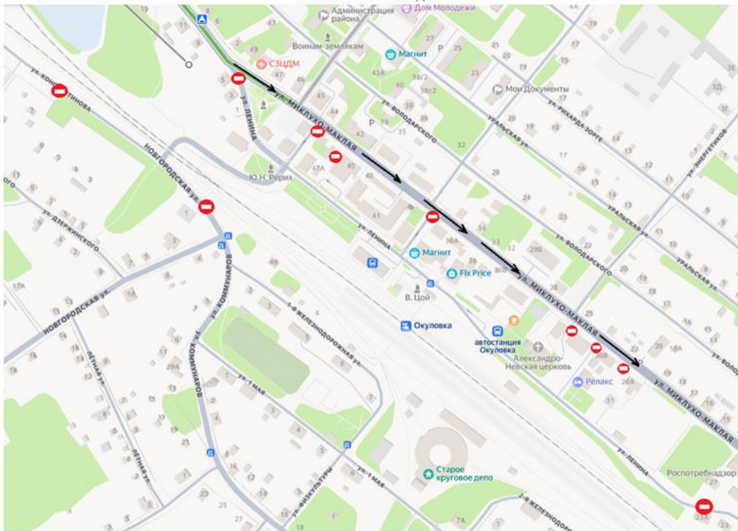
Схема перекрытия движения всех видов транспорта на 20.09. 2025 года

Дорожный знак 3.1 «Въезд запрещен» — Маршрут временного объезда